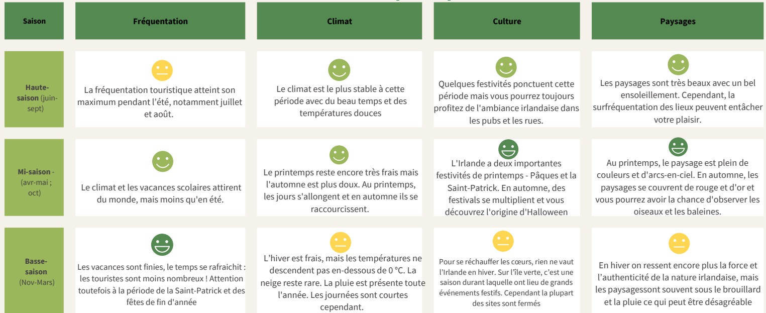
Tableau de saisonnalité : quand partir en Irlande ?